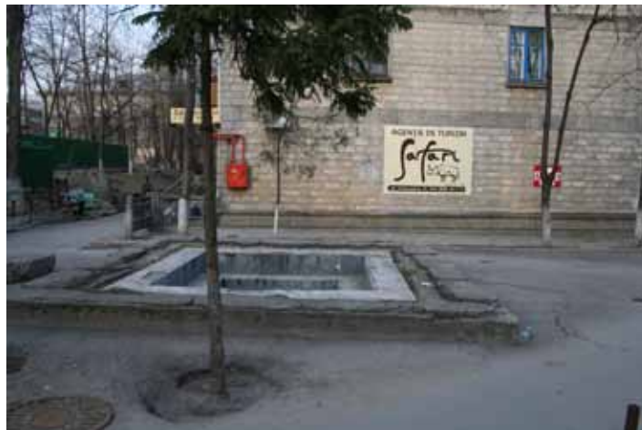
Situția actuală (spațiu nevalorificat și ruinat), 2008