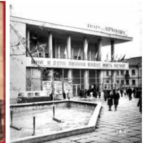
Teatrul Cehov, perioada sovietică