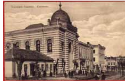
Imagine de epocă, sec. XIX-XX