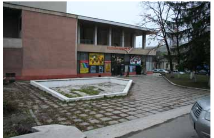
Situția actuală (havuzul golit de apă), 2008