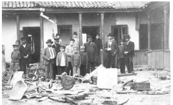
Imagină de epocă, 1903