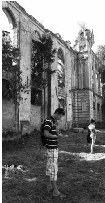
Încadrarea în centru (ortophoto 2011)