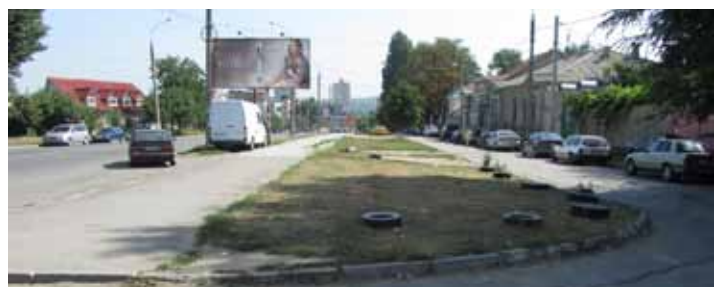
Situația actuală (spațiu nevalorificat și uitat), 2012