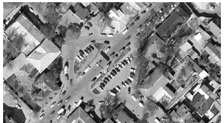
Situația actuală (stradă cu circulație intensă), 2012