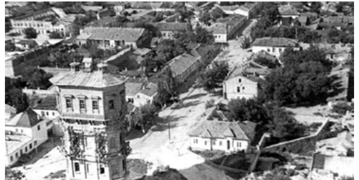
Imagine de epocă, 1947